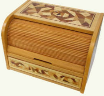
Çekmeceli Ekmek Dolabı

G:44 D:32 Y:32 ölçülerinde, stor kapaklı, 18 mm yonga levha üzeri marketri ve kaplamalı çekmeceli natürel vernikli üründür.